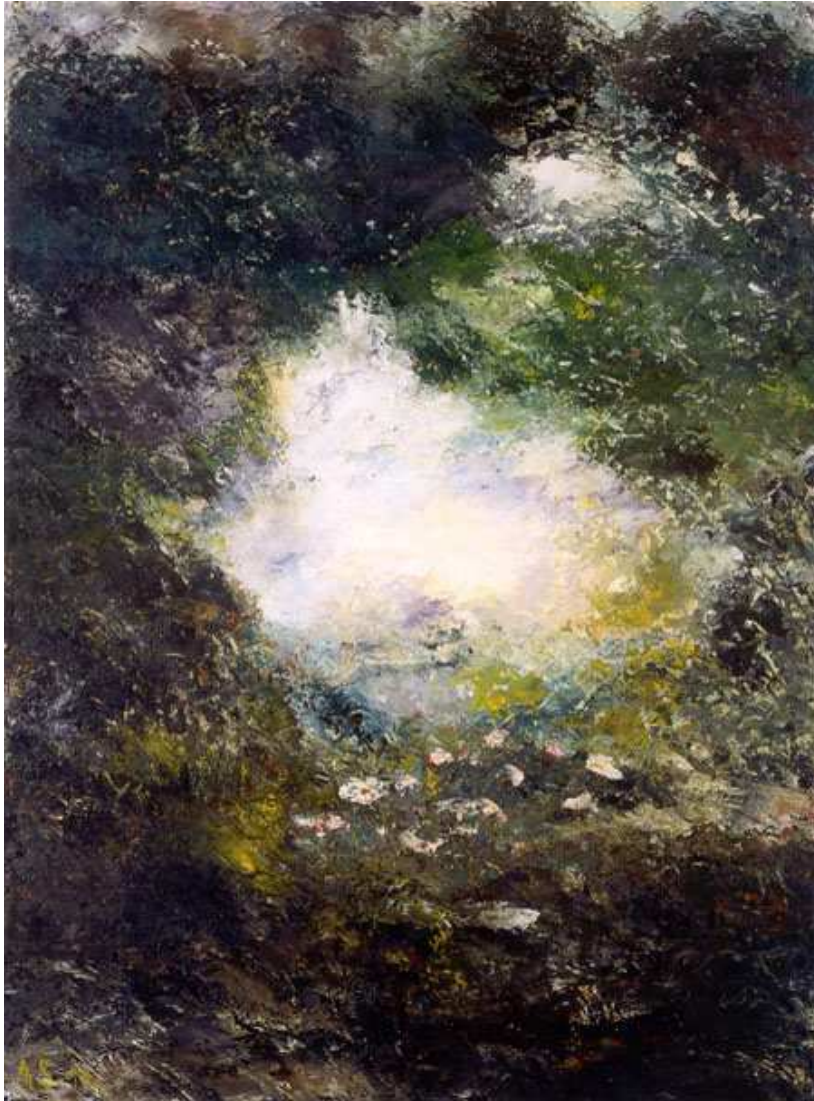
Pays merveilleux (1894) Huile sur carton : 72,5 x 52 cm Stockholm, Nationalmuseum