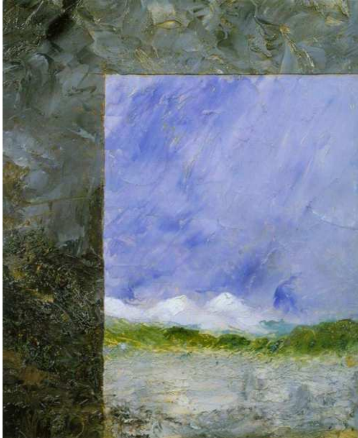
Image double (1892) Huile sur panneau : 40 x 34 cm Collection privée